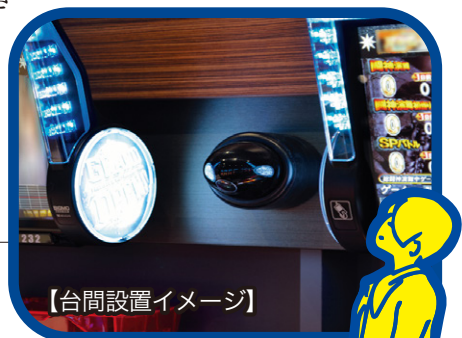
【台間設置イメージ】

瞬時に会計が完了する商品タグの実用化を急ぐ。省人化・少人化は、多くの業界で切実な課題となっている